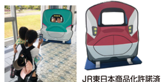
JR東日本商品化許諾済